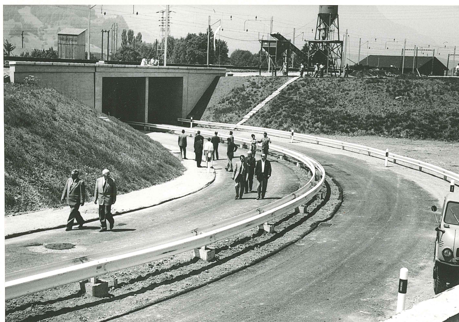
Juli 1964 N4, Anschlussbauwerk Seewen Zufahrt zur Unterführung im Acherli. Besichtigung kurz vor der Eröffnung.